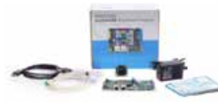
phyBOARD-Pollux Development Kit