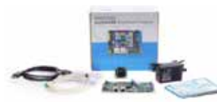
phyBOARD-Pollux Imaging Kit