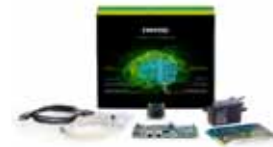
phyBOARD-Pollux AI Kit